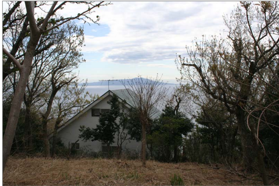
伊豆大島を正面に望む東南向きの暖傾斜地です