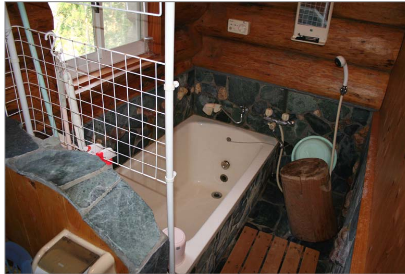
熱い温泉が楽しめる浴室