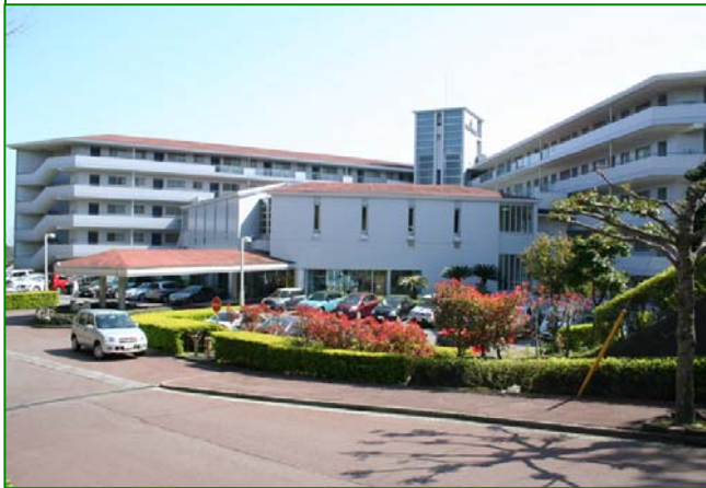
スカイリゾート伊豆高原の外観