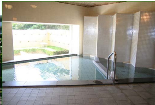
かけ流しの温泉大浴場