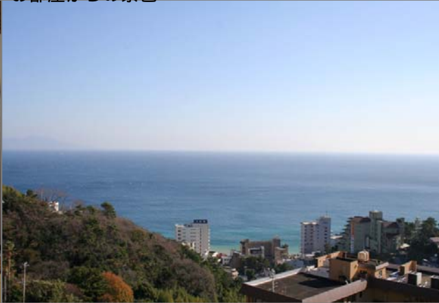
お部屋からの景色