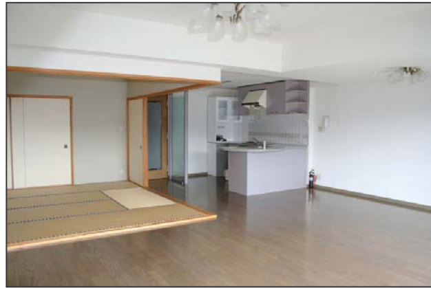
部屋から海と伊豆諸島を一望