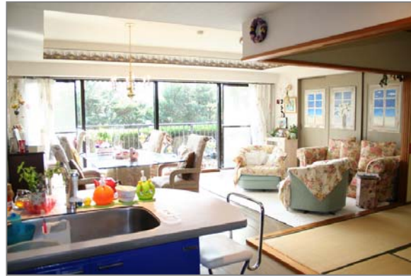
平成18年リフォーム済の室内