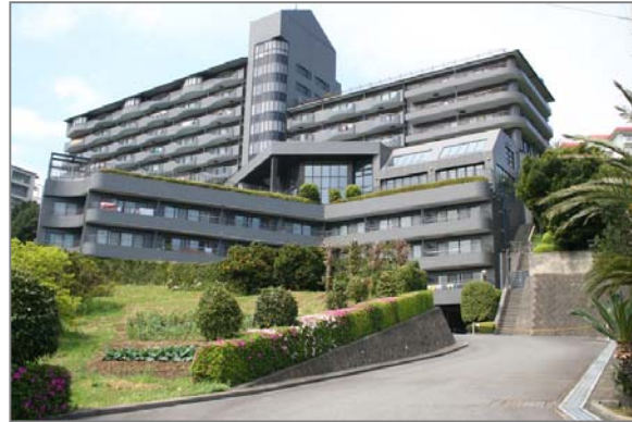
コートヴィラ熱川外観