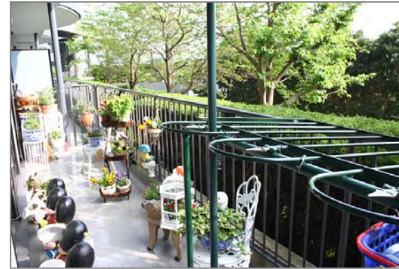
ガーデニングが楽しめるテラス