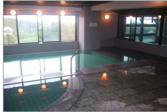
かけ流しの温泉大浴場